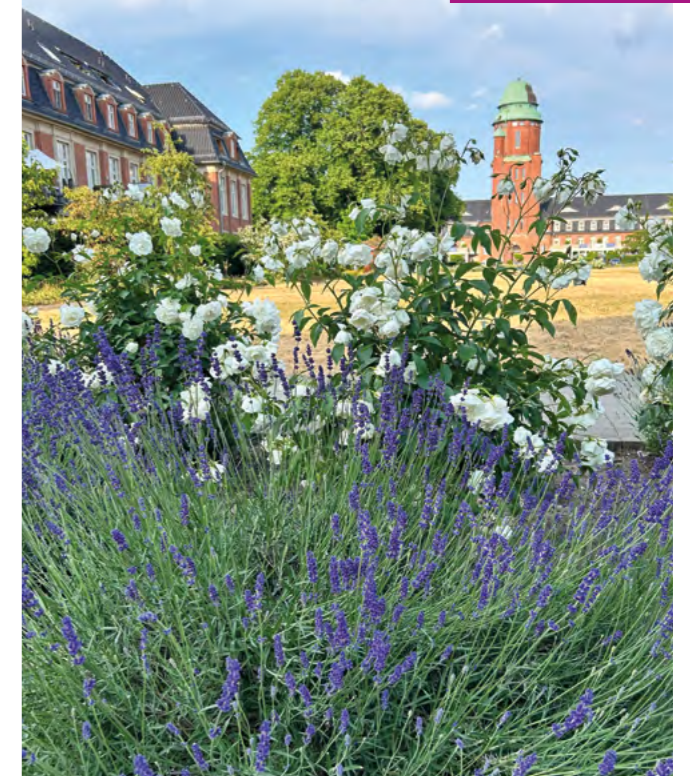
Frischer Sand und Mulch kommt noch

Damit die Mühe nicht vergeblich ist, und es den ganzen Sommer über schön bleibt, haben wir eine Bitte an alle Eltern und die Erzieherinnen der Kitas: Achtet darauf, dass eure Kinder die Beete schonen. Das gilt für die Rosen und Lavendelbeete und auch die Blumenbeete auf beiden Seiten der Rasenfläche. Der Campus und die Spielplätze bieten Platz genug zum Toben und Buddeln. Falls ihr die Kinder gärtnern lassen wollt, finden wir im Quartier auch dafür einen Platz. Fragt uns: info@quartier21.net .