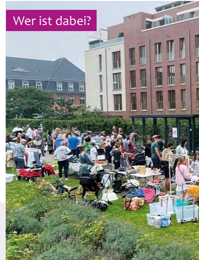
Wieder auf dem Campus