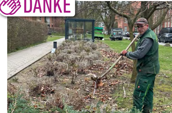
Mit Mühe wieder fein gemacht