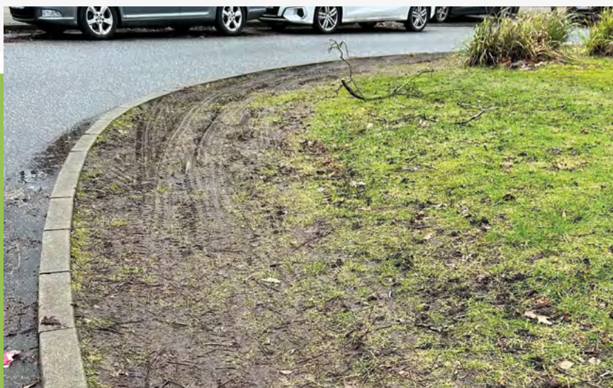
Pfosten vergammelt und kaputt gefahren

Dürfen wir mal ausnahmsweise jammern? Eigentlich verkneifen wir uns das konsequent und zeigen hier in der Quartierspost stattdessen lieber positive Beispiele, die nachahmenswert sind und das Quartier voranbringen. Aber der jahrelange (!) Versuch, das Bezirksamt Nord dazu zu bewegen, die morsche Holzpfosten (amtlich: Eichenspaltholzpfähle) im Straßenbegleitgrün zu erneuern, hat erst das Bezirksamt und nun unsere Geduld überfordert. Die kleinen Pfosten beschützen die Grünstreifen vor rücksichtslosen Autofahrern. Was passiert, wenn sie verfault sind, kann man an etlichen Stellen im Quartier sehen.