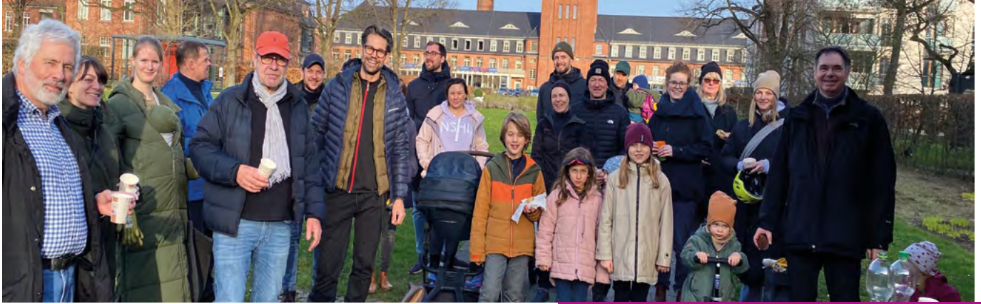
Die Saubermacher im Quartier