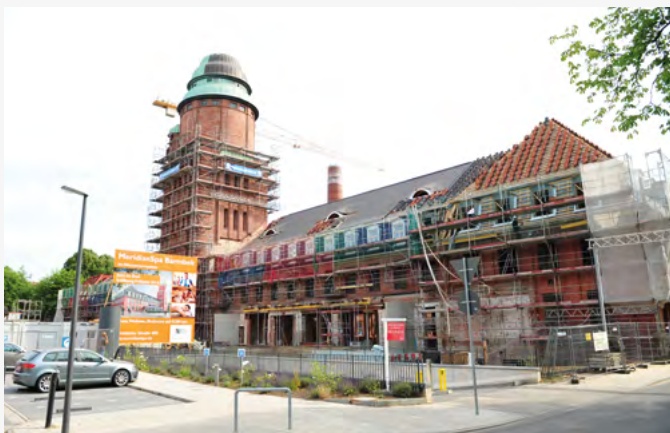
Damals lange eine Baustelle, heute unser Wahrzeichen

viel länger als geplant hingezogen. Der Umbau der ehemaligen Wäscherei in ein Gasthaus und eine Fitness- und Wellnessoase und in Praxen und Büros war sehr anspruchsvoll. Und dann ist auch noch die Baufirma bankrott gegangen. Aber der neue Eigentümer hat alle Schwierigkeiten überwunden, eine neue Baufirma gefunden und das Wasserturmpalais vollendet. Jetzt ist es unser Wahrzeichen. Deshalb finden wir die Idee von Hamburg Team, dem Projektentwickler des Quartiers 21, sehr gut, diesen 10. Jahrestag zu feiern. Noch steht nicht fest, was und wie das geschieht. Wir bleiben dran.