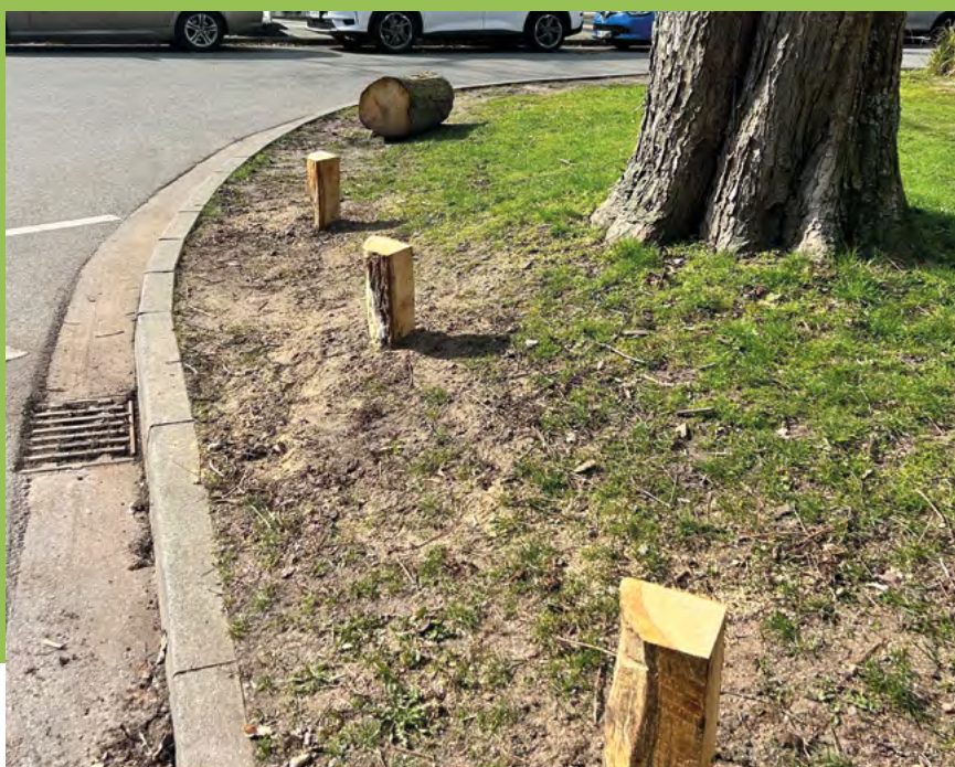
Die fehlen leider noch an einigen Stellen

Sie nach 13 Jahren zu erneuern, scheiterte erst an Lieferschwierigkeiten und dann am Abarbeitungsstau der vom Amt beauftragten Firma. Unser Angebot, dass unser Quartiersmeister die mittlerweile gelieferten Pfähle einschlägt, scheiterte an Verwaltungsvorschriften. Woran unser Angebot scheiterte, dass wir der Firma zeigen, wo die zahlenmäßig zu wenigen Pfosten am dringendsten benötigt werden, wissen wir nicht. Sie stehen nun teilweise an den falschen Stellen, und am Kreis AJL/AKR fehlen sie komplett. Unsere Sofortmaßnahme, dort zum Schutz und nur vorübergehend Baumstämme abzulegen, hat uns den amtlichen Hinweis eingehandelt, dass das verboten und strafbar ist. Grrr! So, nun aber Schluss mit jammern. Stattdessen sind wir sehr optimistisch, dass demnächst von irgendwoher und wie von Zauberhand eingeschlagen, die fehlenden Pfosten an den richtigen Stellen stehen werden.