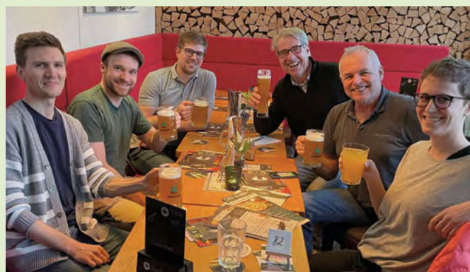
Teile der Rennradgruppe bei der Saisonvorbereitung

geschieht spontan vor dem Start. Über diesen regelmäßigen Termin hinaus kommt es zu spontanen Verabredungen. Vorschläge dazu gibt es dann über die WhatsApp App Gruppe. Also, wer noch Lust hat, ist herzlich willkommen. Einfach eine Mail an rennrad@quartier21.net schicken und dann kann es losfahren. Bis bald.