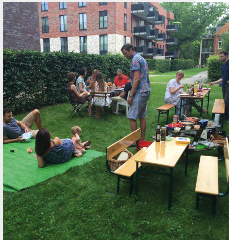
Hausfest in der AJL

Haben wir euch inspiriert, oder hat euer Hausfest schon eine lange Tradition? Dann schickt uns ein Foto von eurem Hausfest: info@quartier21.net .